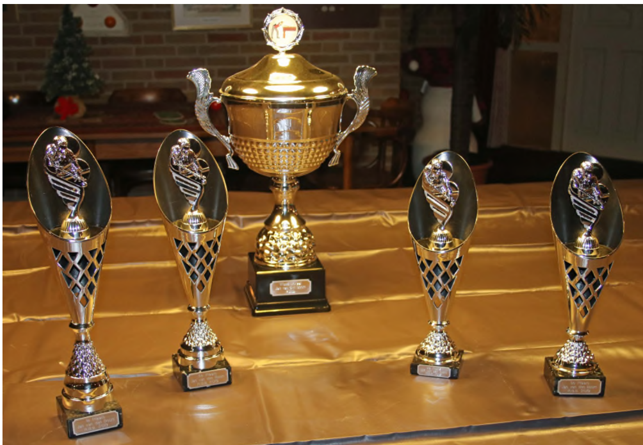
De Jan van den Boom-bokaal en de prijzen 1 tot en met 4.