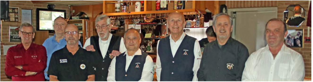
De 8 finalisten die gaan strijden om de Jan van den Boom-bokaal