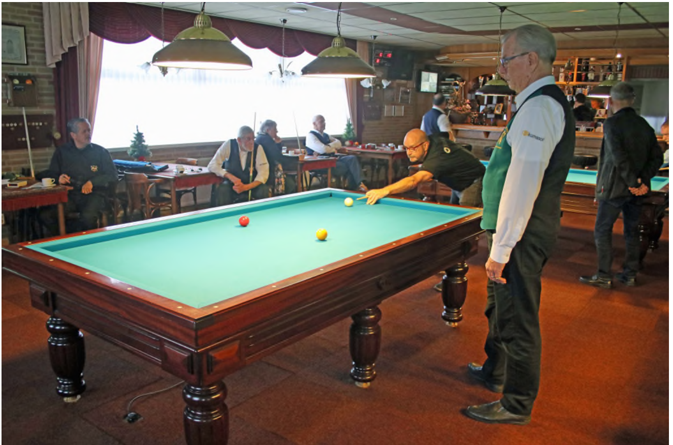
Een actie moment tijdens de finaledag